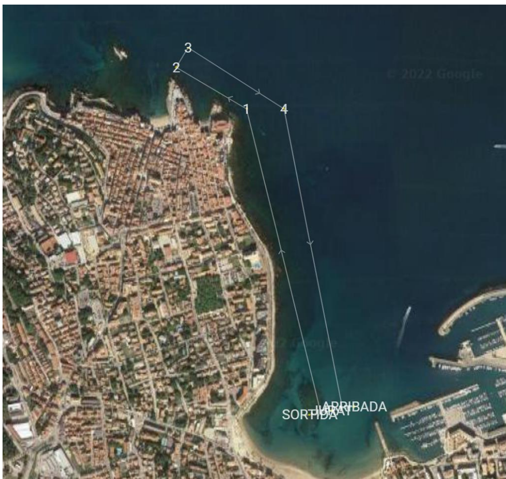
Zona de sortida, arribada i escalfament: